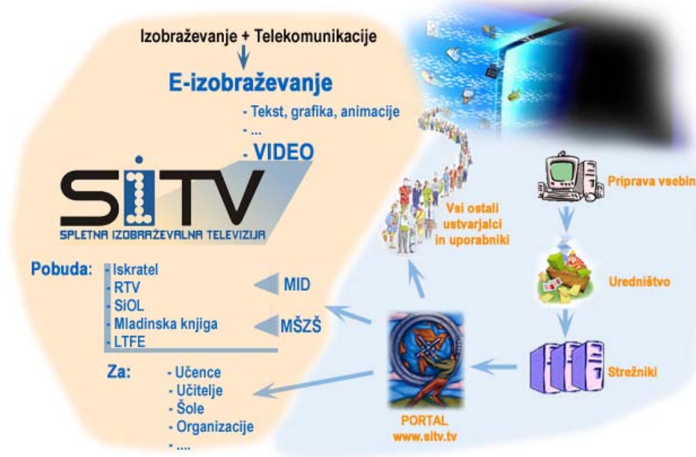
Slika 1: Celotna slika projekta SiTV