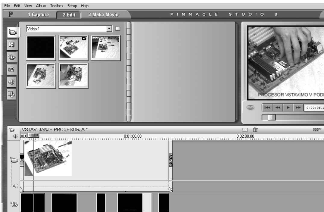
Slika 2: Obdelava video posnetkov

Na koncu smo multimedijški učbenik objavili na spletnem strežniku. Na računalniku, kjer gostuje multimedijški učbenik, je nameščen Internet Information Services (IIS) in Frontpage Extensions, ki omogočata anonimen dostop do učbenika, ter delovanje strani, ki uporabljajo Microsoftove podaljške za interaktivne strani, kot so npr. iskanje po straneh ali forum.